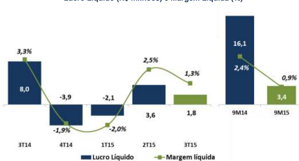
Lucro Líquido (R$ milhões) e Margem Líquida (%)

Esse resultado demonstra o cenário desafiador que a WLM tem enfrentado no ano.